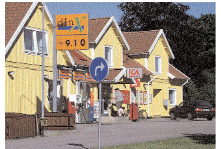
Centrum i Grimslöv är sig likt trots flera valrörelser med fagra löften om stora förändringar.

Nu är det åter dags att ge nya vallöften i samma fråga. Återstår att se om löften denna gång kommer att infrias. Tredje gången gillt kan väl Grimslövsborna kanske hoppas på. Men visst borde det snart vara dags att få något gjort. Ett garanterat säkert sätt för att något äntligen ska hända är att rösta på Alvesta Alternativet i höstens kommunval.