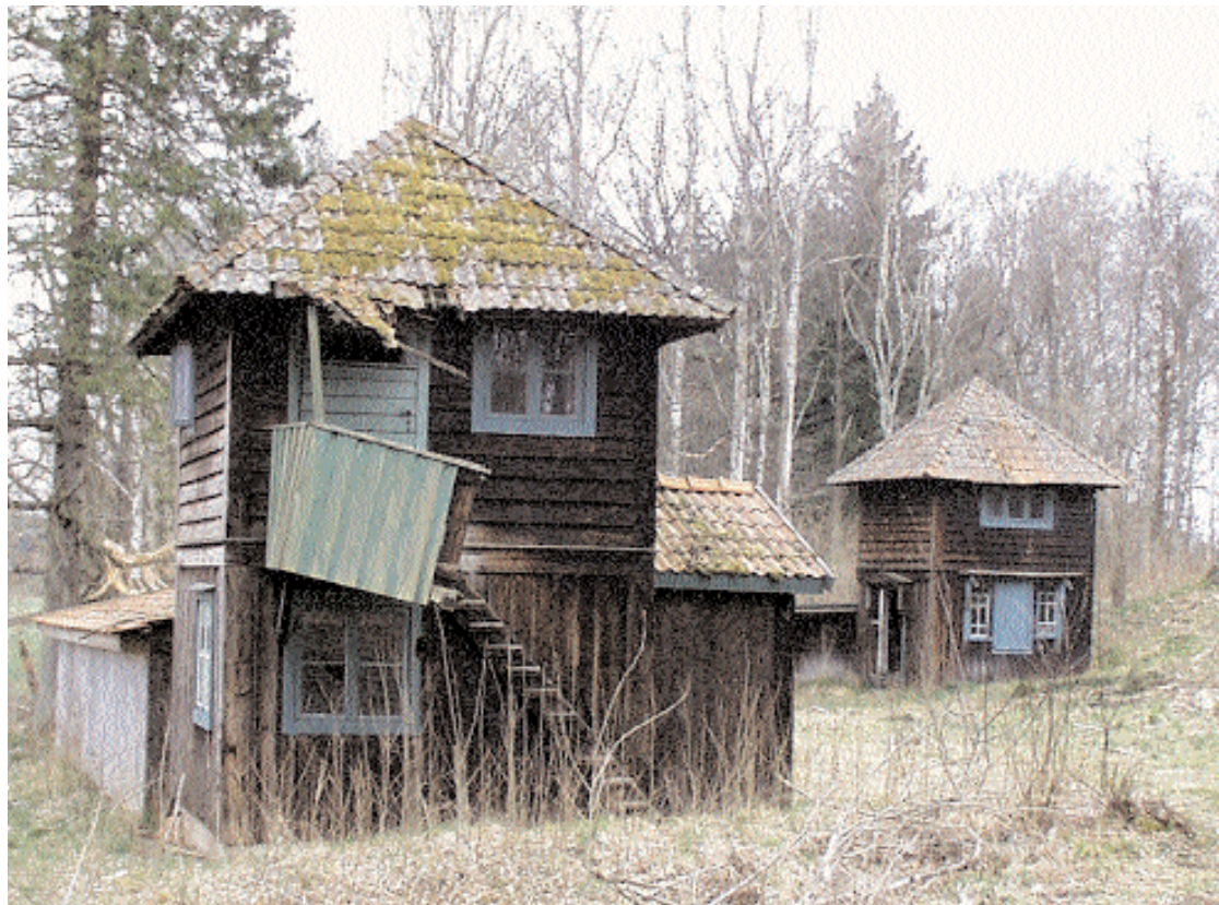
Efter en motion från Alvesta Alternativet kan äntligen en gång- och cykelväg från Alvesta till natursöna Kloster i Benestad bli verklighet.

Bron över Skaddeån är visserligen ingen cykelbro, men med lite god vilja kan man alltid leda