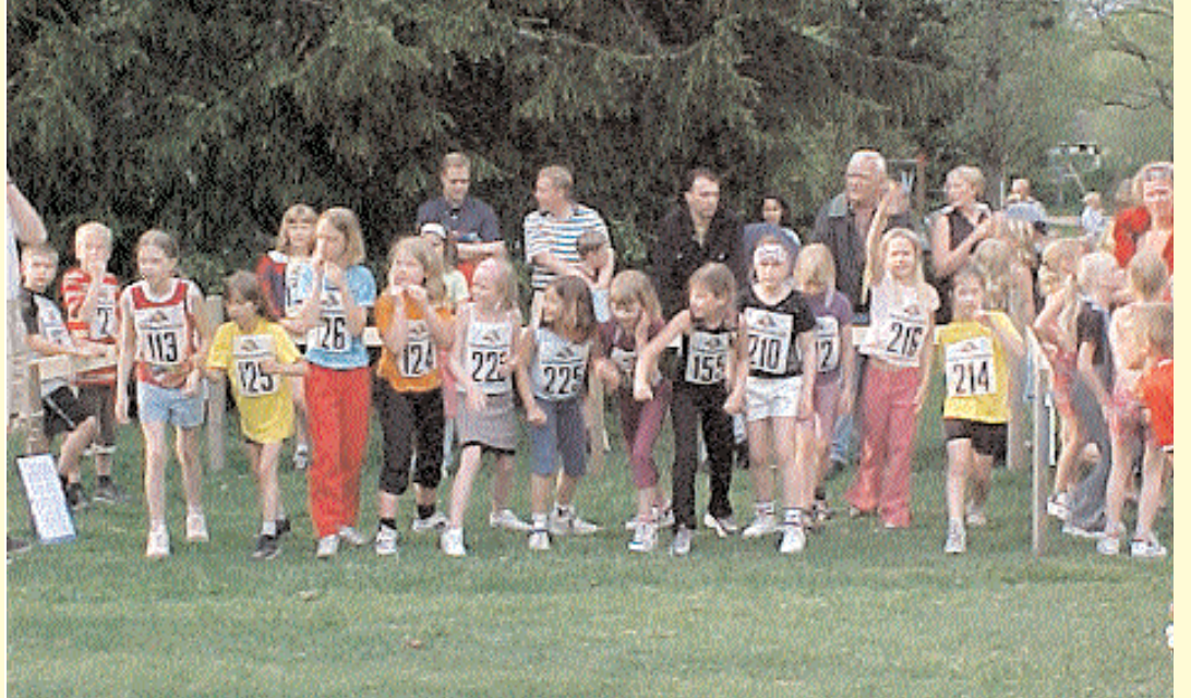
Hagaparksterrängen lockar många yngre förmågor till etapptävlingarna. Alvesta FI har lyckats hålla denna populära tävling vid liv i många säsonger och hittat många ämnen till sin övriga verksamhet.