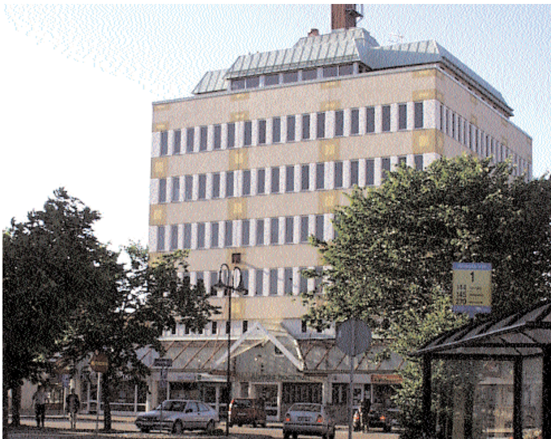
Kommunledningens syfte är att koncentrera all makt högst uppe i det här huset. En koncernbildning av samtliga kommunala bolag och dessutom VA-sidan skulle tillse att man fick tillgång till ytterligare några miljoner.

Att bolla med olika kommunala bolag ger inte medborgarna den klara insyn i kommunens verksamhet som faktiskt är lagstadgad. Öppenhet med medborgarnas medel borde vara ledstjärna också för dagens socialdemokrati, även på det lokala planet i Alvesta kommun.