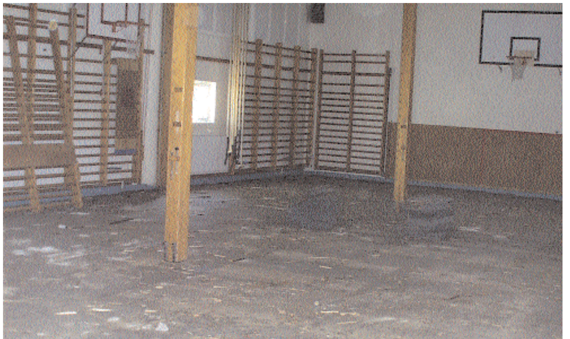
... för så här ser det ut i Prästängsskolans gymnastiksal idag när eleverna lämnat skolan för sommarlov.

Att i det här läget genomföra beslutet om renovering av gymnastikhallen vore förkastligt. Frågan kan i stället bli att man tvingas bygga helt nytt och i så fall blir det säkert frågan om en större hall. Men det kommer säkerligen att gå många turer innan frågan kommer till ett avgörande.