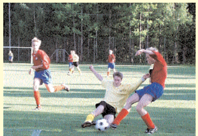
Moheda IF:s unga killar tar sig här ann Öster och visar ingen respekt för storebror. Ungdomsfotbollen för både killar och tjejer är omfattande i hela kommunen