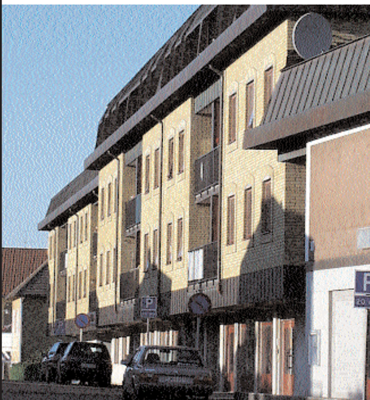
48 handikappanpassade lägenheter i Rådmannen ska på socialnämndens initiativ övergå till ordinärt boende.

De beräkningar som ligger till grund för beslutet om neddragning av äldreomsorgsplatser är det ingen som begriper sig på.