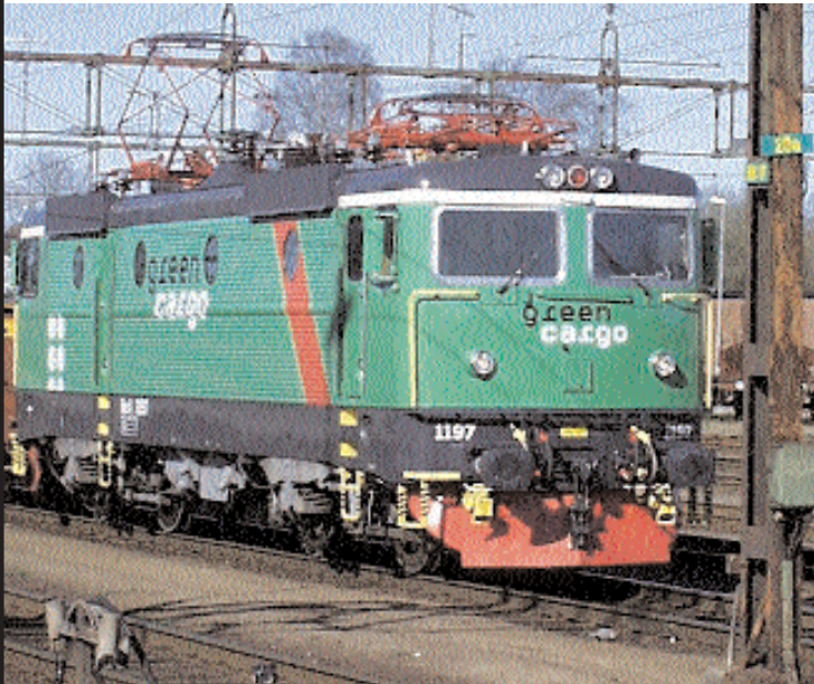
Green Cargo, som är huvudaktör på järnvägsgods, är mycket kritisk till det förslag till bangårdsombyggnad som Banverket föreslår.

Green Cargo, tidigare SJ gods, gör definitivt tummen ned för det förslag som Banverket lagt fram för ombyggnad av Alvesta Bangård.