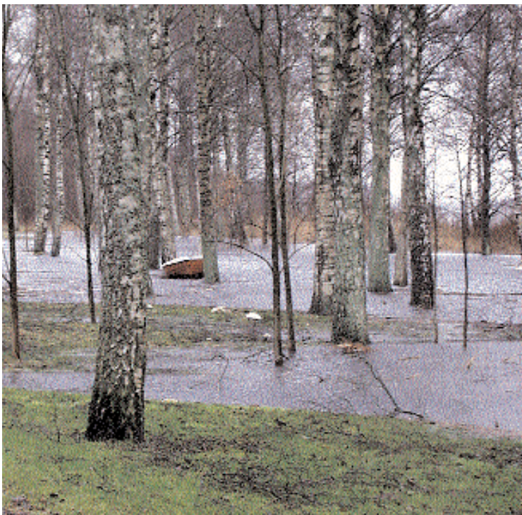
Det ser inte speciellt attraktivt att bygga på Salens strand under sådana här betingelse.

Men med bilden av ett markområde under vatten borde göra vem som helst övertygad om olämpligheten av att bygga bostäder på det markområdet.