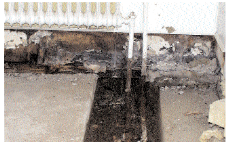
Det är ingen vacker syn beskådaren möter nu när innergolvet frilagts i omklädningsrummen till Prästängsskolans gymnastiksal. Väggsyllen är genomdränkt.

Den tänkta renoveringen av Prästängsskolans gymnastikhall har fått förhinder.