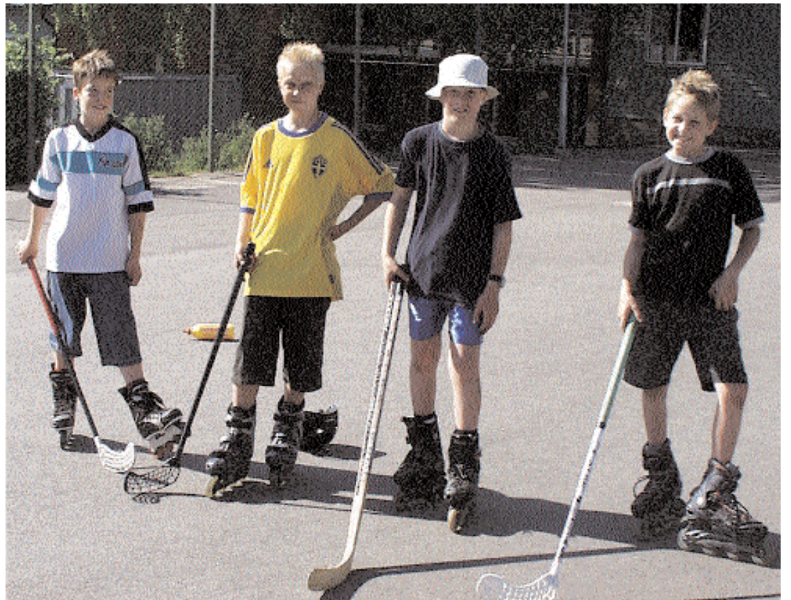
De sista dagarna under vårterminen var skolgården en given plats för att spela landhockey på för eleverna på Prästängsskolan. Men var ska de vara under sina idrottslektioner till hösten? Det lär knappast bli i gymnastiksalen...

Prästängselever lär få vänta på sin gymnastiksal