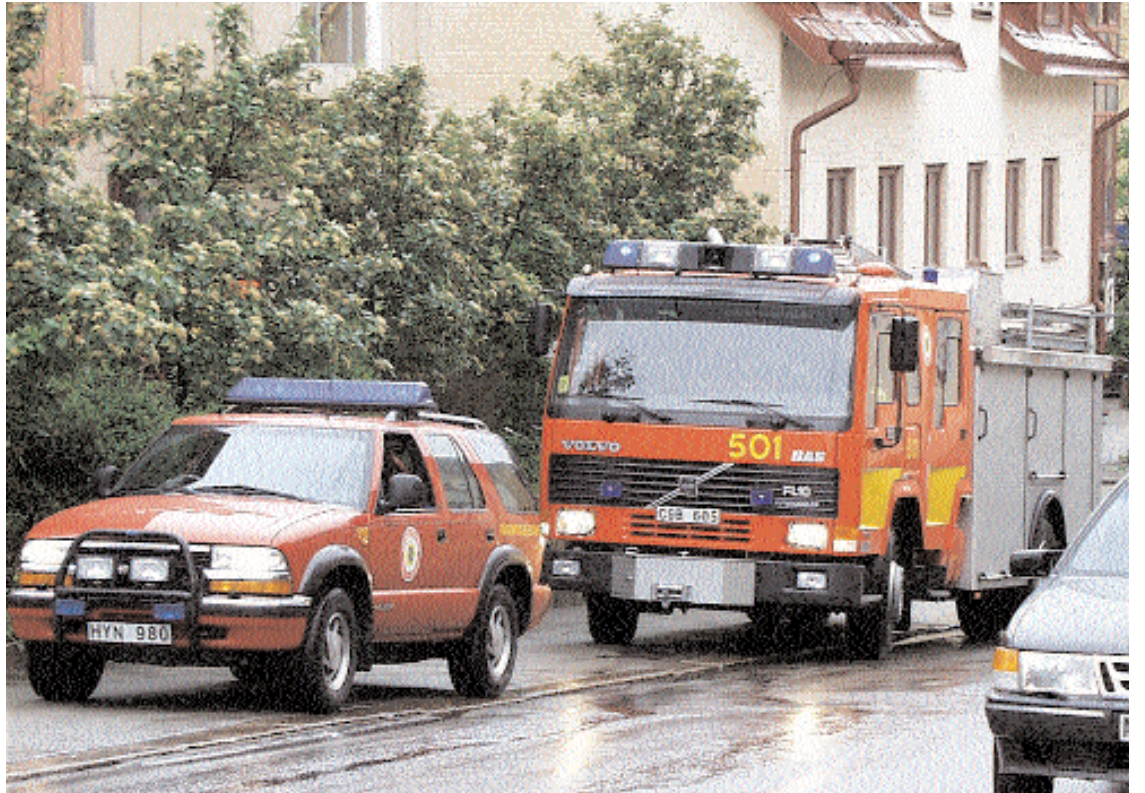
Än så länge har vi fast anställd räddningstjänstpersonal kvar i Alvesta. Det kan vi skatta oss lyckliga åt som vid denna utryckning till ett falskt larm på Bryggaren. Snart lär vi inte få se chefsbilen längst fram vid larm.

Den nya organisationen för befäl i beredskap blev inte lång-