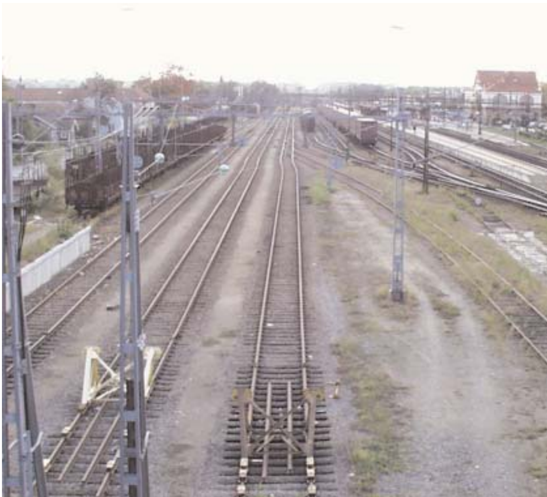
Bangårdsutredning har varit ute på förnyad remiss. Förslaget förkastades av samtliga tågoperatörer. Green Cargo menade att om man valde det föreslagna alternativet så innebar det att man tyckte att ett resecentrum var viktigare än att regionens näringsliv fick utvecklas. Ord och inga visor från en av de stora aktörerna.