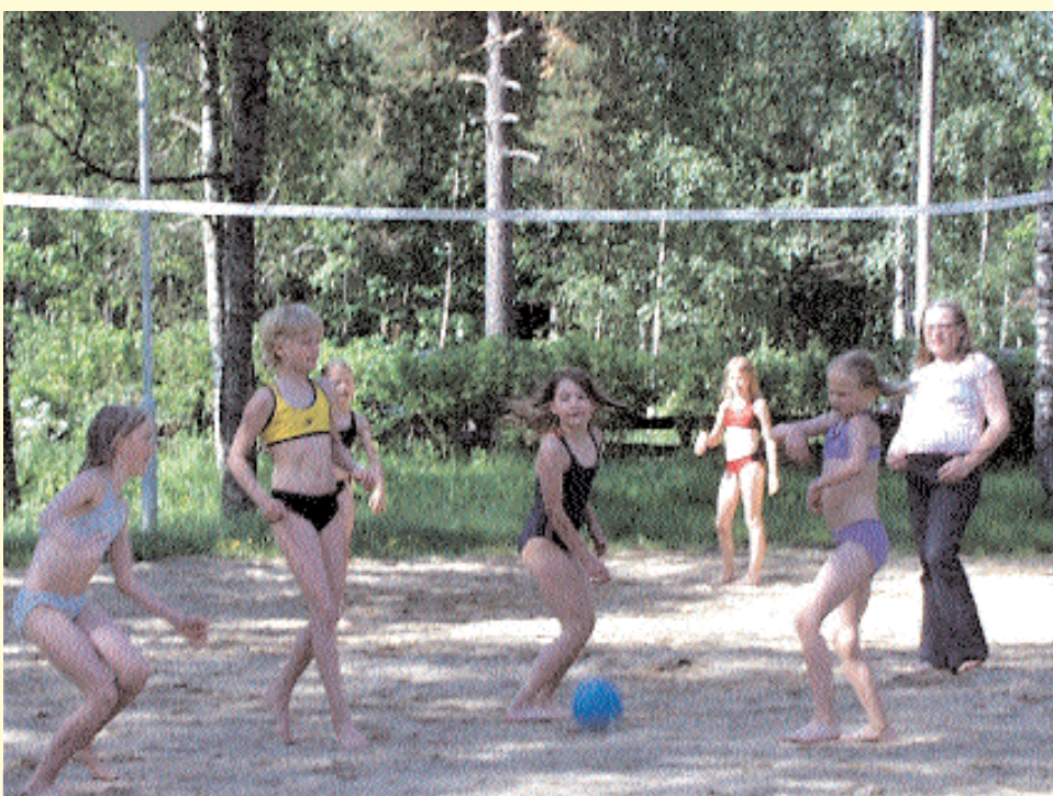
Spontanidrotten är utbredd i hela kommunen. Verksamhet som aldrig registreras men som ändå är i behov av anläggningar. Här spelar några tjejer beachvolley i väntan på nästa dopp.