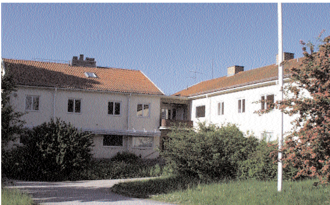
Gamla Torsgården blev inte den lysande affär som kommunledningen tänkt sig. Det hela slutade i konkurs utan att några av alla fagra löften kunde uppfyllas. Nu är fastigheten åter såld. Återstår att se om historien skall upprepa sig.

Alvesta kommuns invånare har dyrt fått betala inträdet i räddningstjänstförbundet. Nästa år får vi ytterligare en påspädning av kostnaderna samtidigt som vi upplever klara försämringar av den räddningstjänst vi hade före sammanslagningen. Det är kanske dags att börja förbereda ett lika snabbt uttag som intåg i förbundet innan vi har brandskattats på vår egen säkerhet.