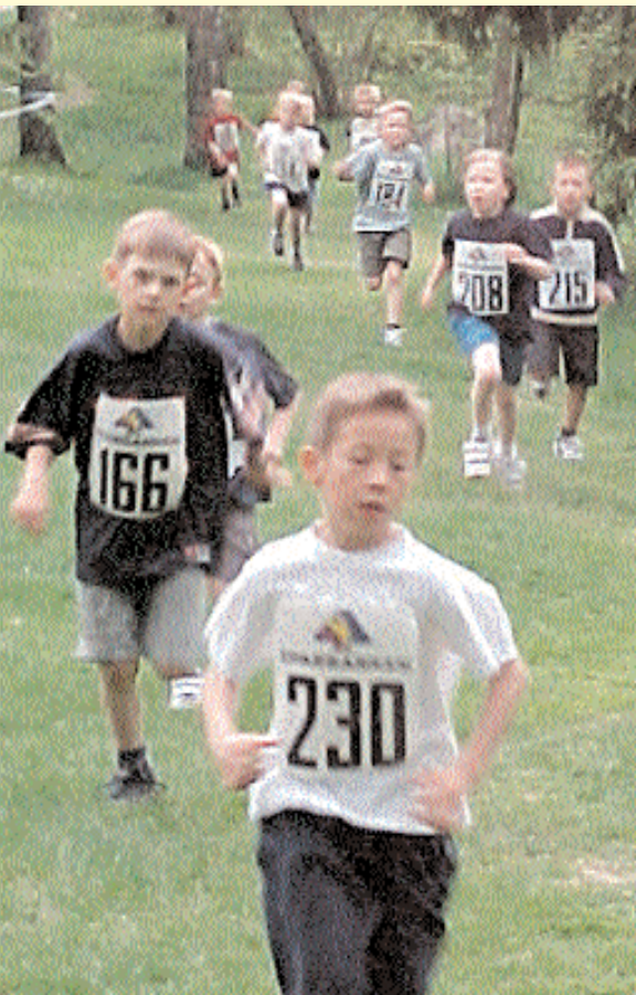
Fullt ös ända in i mål. Viljan att kämpa väl lyser ur alla tävlandes ansiktsuttryck i Hagaparksterrängen.

Kultur och fritidsnämnden och förvaltningsorganisationen lever farligt.